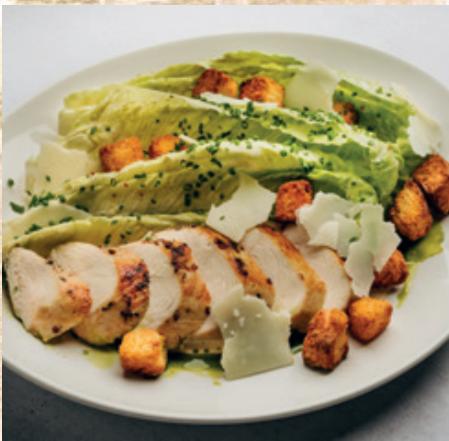
Cézár saláta grillezett csirkemellel és parmezán forgáccsal