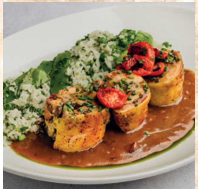
Gödöllői töltött csirkecombfilé illatos jázminrizszel és vajon párolt zöldborsóval