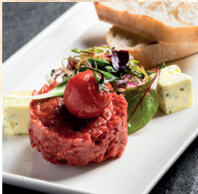
VarjúPapa tatárbeefsteakje friss zöldségekkel, vadkovászos házi kenyérrel