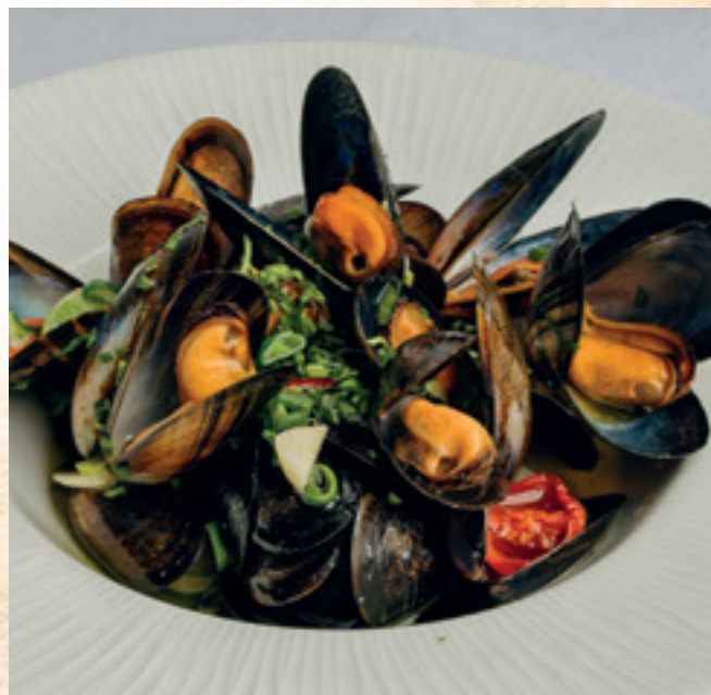
Fekete kagyló fehérboros vajmártásban