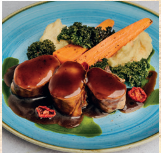
Érlelt sonkával bordírozott szűzderék sült fokhagymás burgonyapürével és habzó vajon piritott karottával