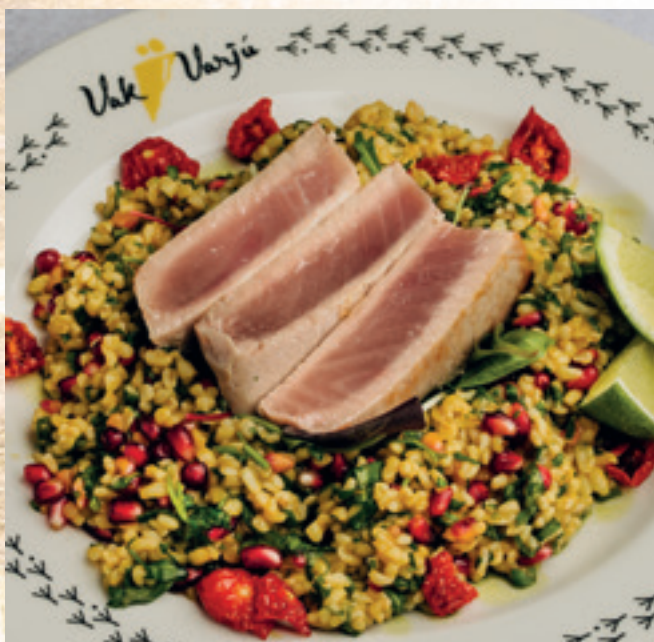
Vöröstonhal-steak mangós-gránátalmás bulgursalátával