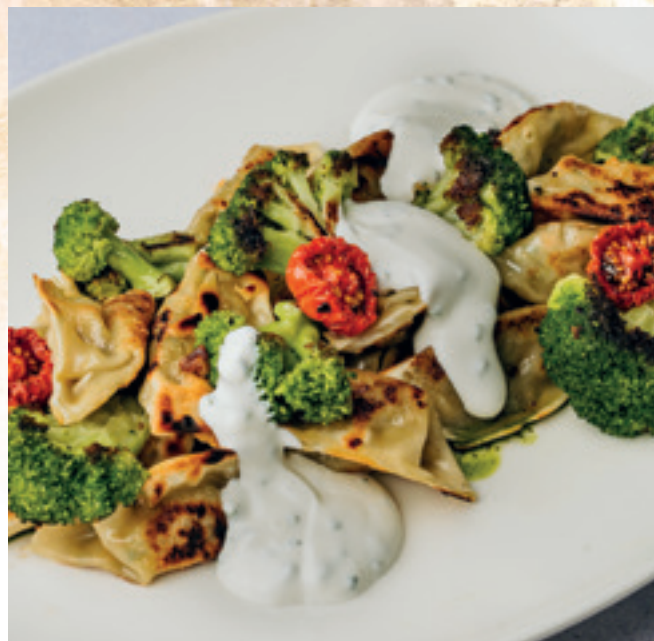
Zöldséges pelmenyi snidlinges tejföllel és sült brokkolival