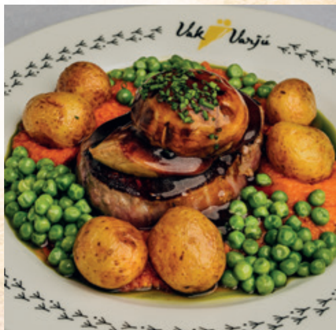
Bélszínsteak lecsókrémmel, pirított parászburgonyával, hízott kacsamájjal és vajban párolt zöldborsóval