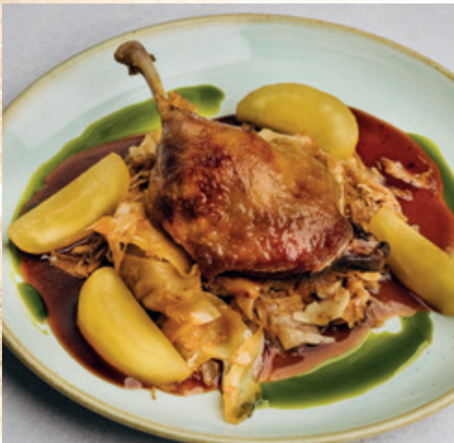
Konfitált kacsacomb káposztás cvekedlivel és akácmezes almával