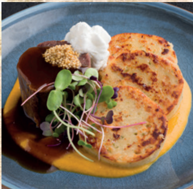
Konfitált marhanyak vadasan, házi szalvétagombóccal és tejfölhabbal