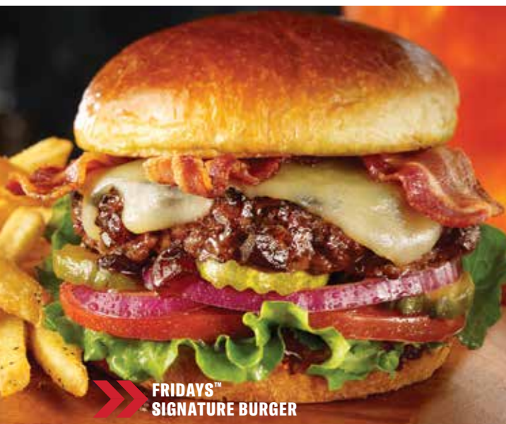
FRIDAYS™ SIGNATURE BURGER

Ételek leírása nem minden esetben teljeskörű, ételérzékenység esetén kérdezze felszolgálónkat vagy kérje allergén összetevőket bemutató étlapunkat!