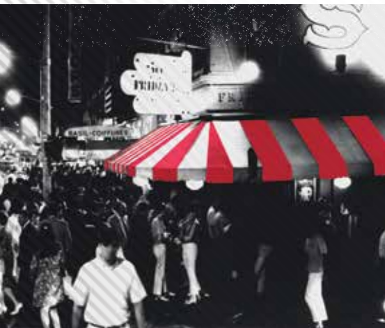
1965 New York - Az első TGI Fridays.