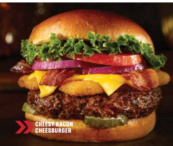
CHEESY BACON CHEESEBURGER