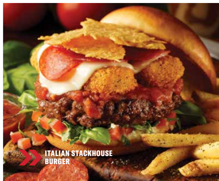
ITALIAN STACKHOUSE BURGER