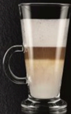
Latte Machiato 630 Ft