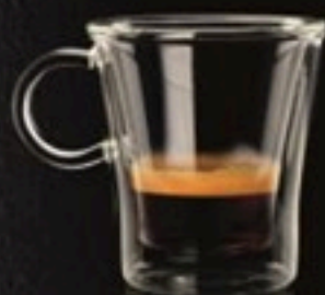
Ristretto 420 Ft