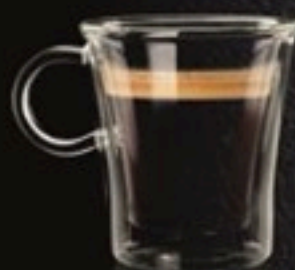
Doppio Espresso 810 Ft