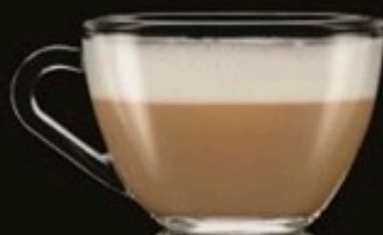
Cappuccino 550 Ft