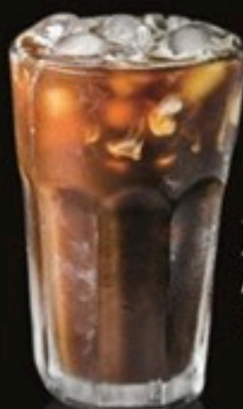
Jeges Kávė / Aйс Кофи 1090 Ft