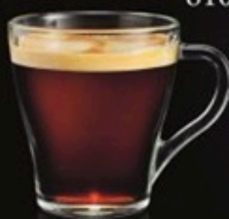
Long Cafė 560 Ft