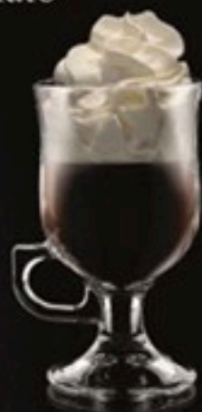
Irish Cafė 1500 Ft