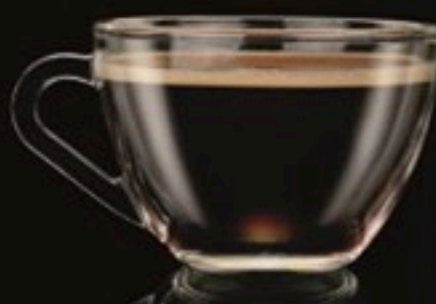
Americano 580 Ft