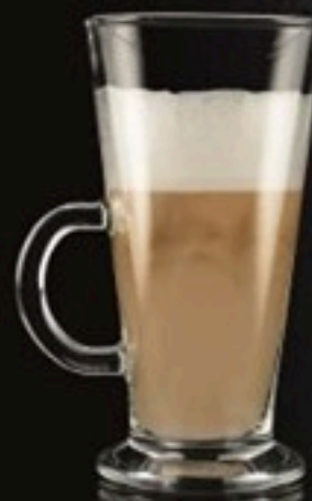
Melange 670 Ft