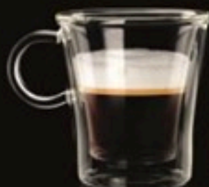
Espresso Machiato 450 Ft