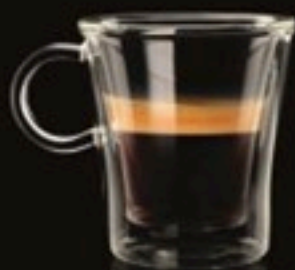
Espresso 420 Ft